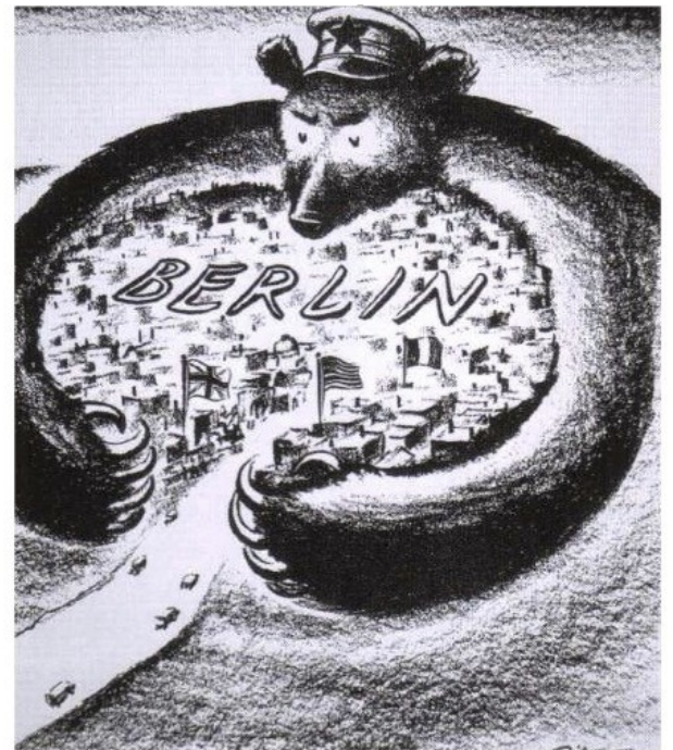
Caricature de l'américain Fitzpatrick, parue dans le St-Louis Post Dispatch en juin 1948.