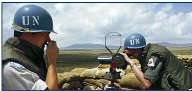
Des observateurs militaires de l'ONUST contrôlant et rendant compte de la situation dans le Golan en Syrie.