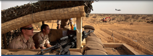
Des Casques bleus hollandais de la MINUSMA monte la garde à Gao, Mali.