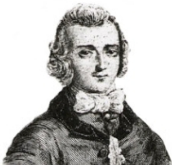
LE CHEVALIER DE JAUCOURT (1704-1779)