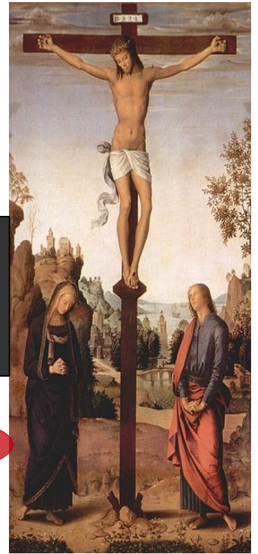
Le Pérugin La Crucifixion , Santa Maria Maddalena dei Pazzi (1496).