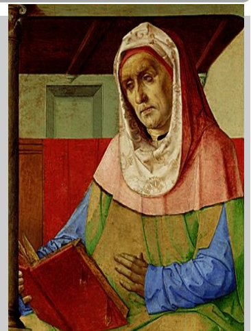
SÉNÈQUE par Juste de Gand (XVe s.) PHILOSOPHE, DRAMATURGE & HOMME D'ÉTAT ROMAIN (v. 4 av.ne. – 65)