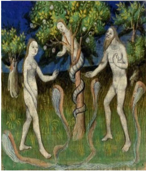
Miniature Le péché originel , Guyart des Moulins, Bible historique, France, Paris, XVe siècle