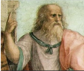
PLATON PHILOSOPHE ATHÉNIEN (v. 427 – 346 av.ne.)

“ - N'est-il pas inévitable que dans une pareille cité (« État », en grec « polis ») l'esprit de liberté s'étende à tout ? — Comment en serait-il autrement ? — Et qu'il pénètre, cher ami, poursuivis-je, dans l'intérieur des familles et qu'à la fin l'anarchie se développe jusque chez les bêtes ? — Comment faut-il entendre ce que tu dis là ? — Je veux dire, répliquai-je, que le père s'accoutume à traiter son fils en égal et à craindre ses enfants, que le fils s'égalise à son père et n'a plus ni respect ni crainte pour ses parents, parce qu'il veut être libre ; que le métèque* devient l'égal du citoyen, le citoyen du métèque, et l'étranger de même. — C'est bien ainsi que les choses se passent, dit-il. — À ces abus, continuai-je, ajoute encore les menus travers que voici : dans un pareil État, le maître craint et flatte ses élèves et les élèves se moquent de leurs maîtres, comme aussi de leurs gouverneurs. ”