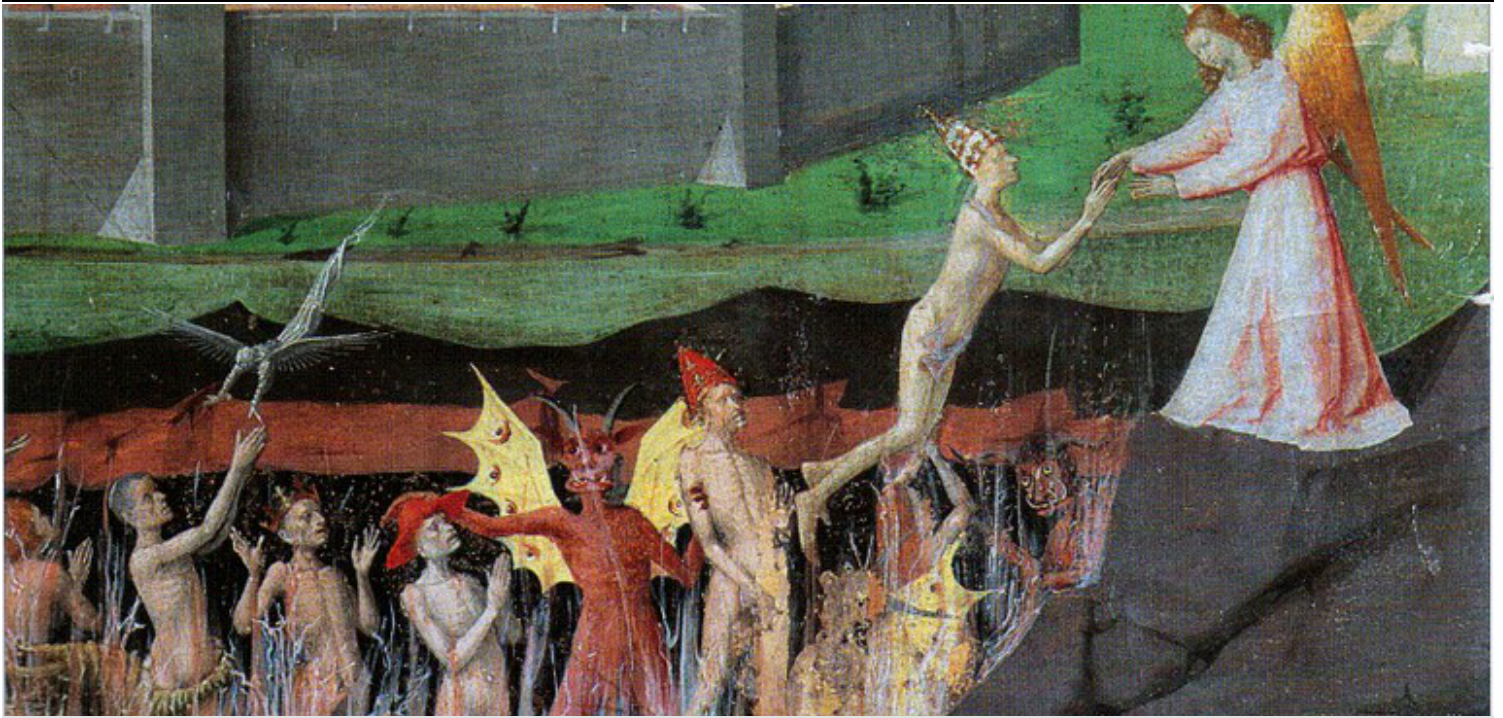
Le pape Benoît VIII († 1024) sort du purgatoire après les prières des moines de