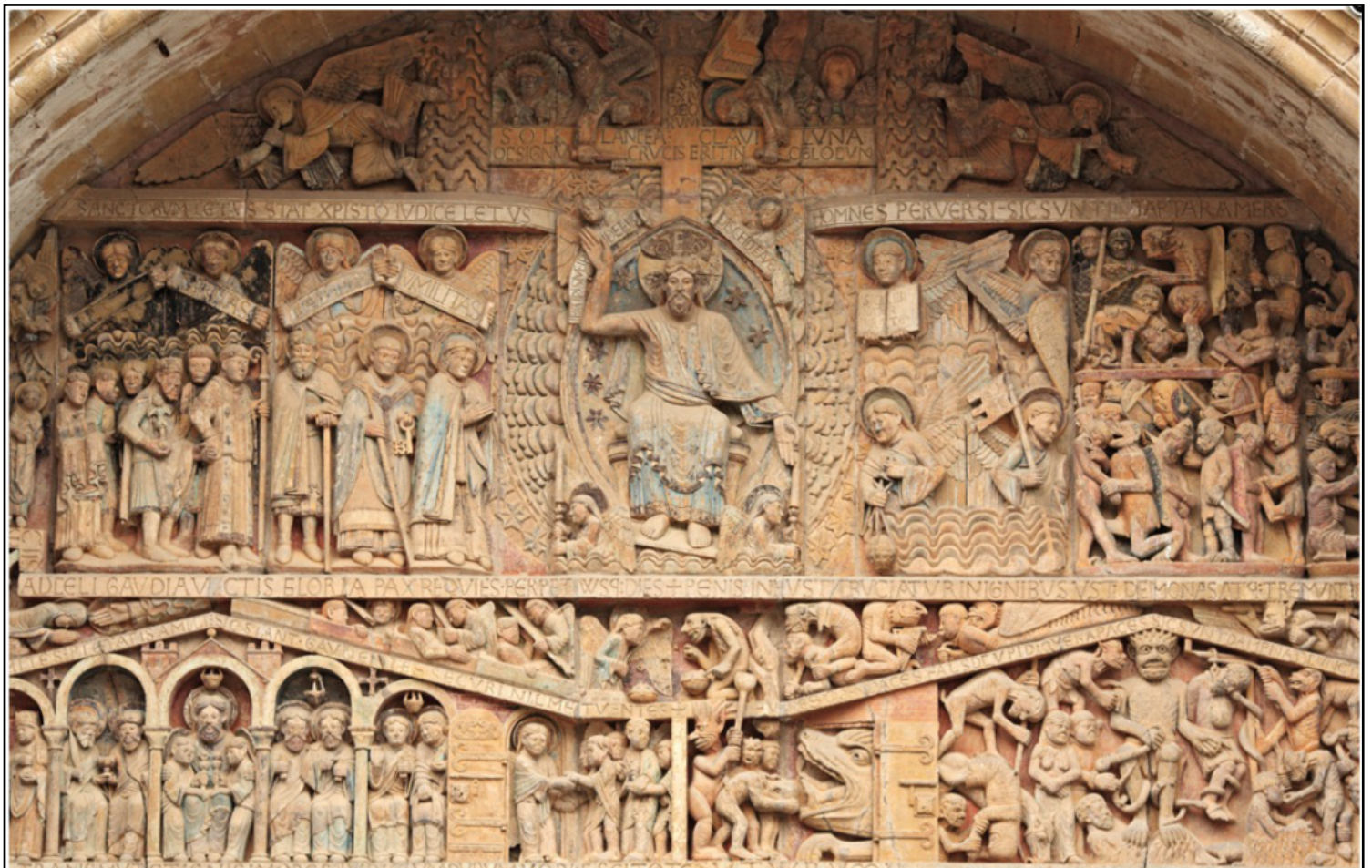
8. LE TYMPAN DE CONQUES (6,70 MÈTRES X 3,60 MÈTRES, DÉBUT XIIIÈ S. )