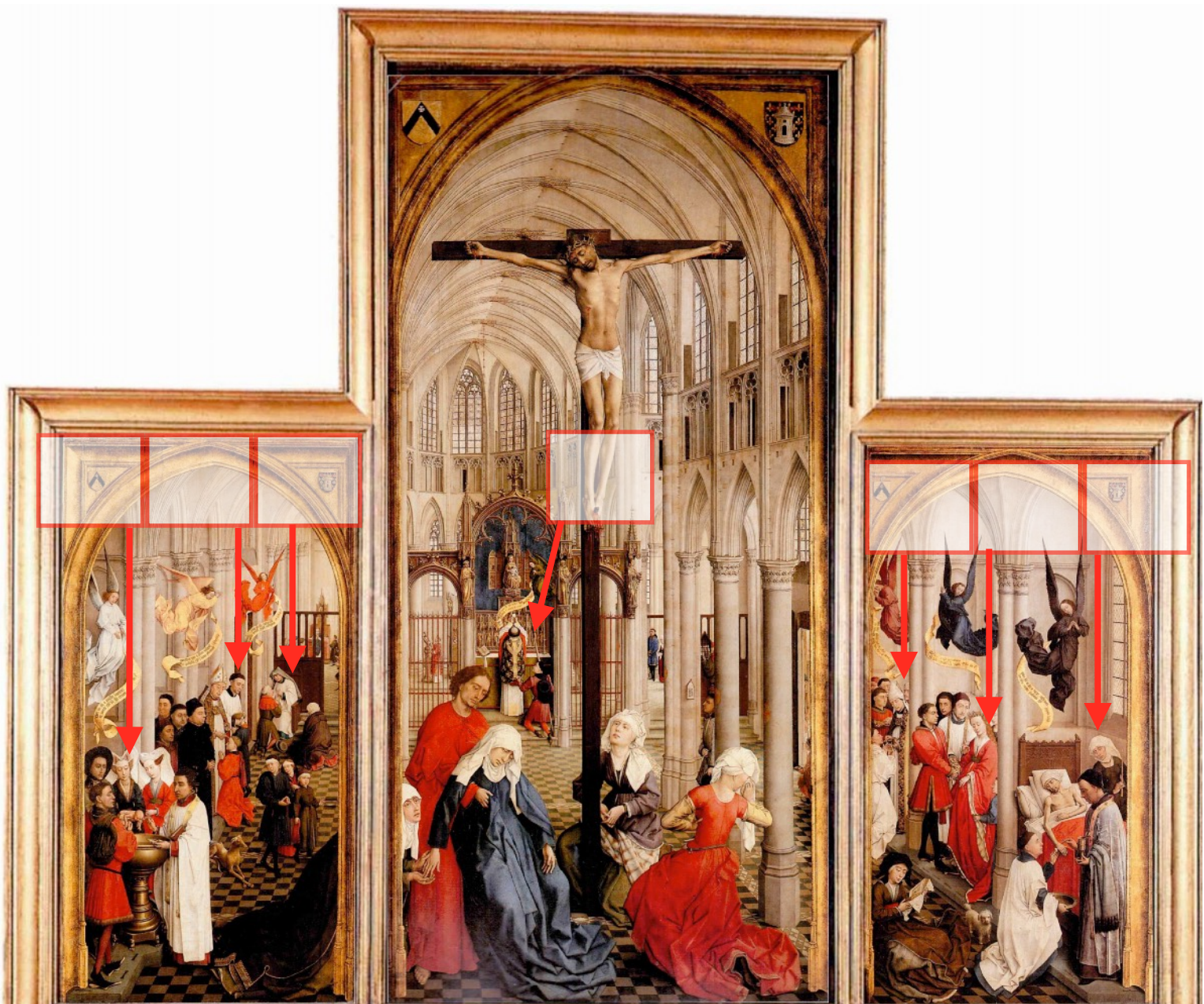
5. Retable de Rogier Van der Weyden , les sept sacraments, musée d'Anvers