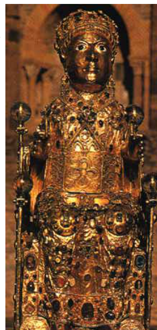
1. Relique de Sainte-Foy

C'est ce purgatoire qui est représenté sur le tympan de l'église abbatiale de Conques.