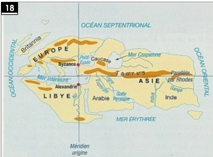
La carte d'Eratosthène (vers 200 avant J.-C.)

Le culte de Sérapis est instauré dès l'époque du roi Ptolémée. Sérapis est la fusion du dieu grec Zeus et du dieu égyptien Apis-Osiris.