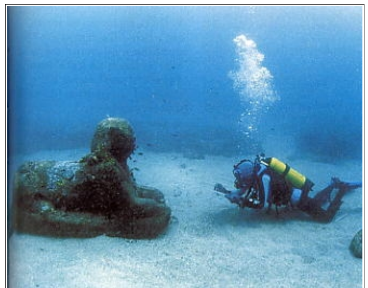
19. Découverte d'une statue de sphinx de l'époque hellénistique dans le port d'Alexandrie

À l'époque hellénistique la connaissance du monde fait de grands progrès. Eratosthène rassemble tous les renseignements disponibles pour dresser une carte du monde plus précise que les précédentes.