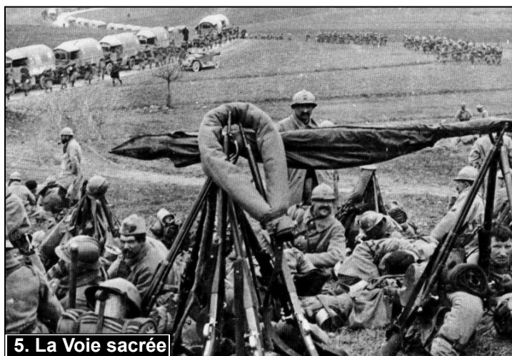
5. La Voie sacrée