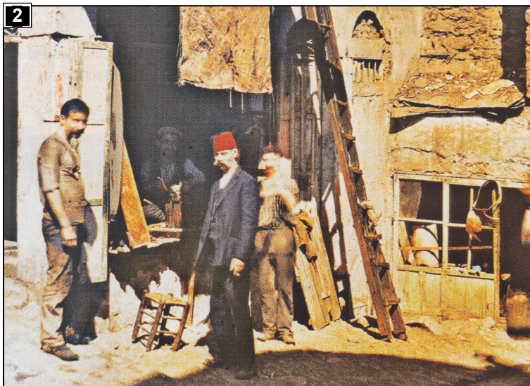
Forgerons dans le quartier arménien d'Istanbul, 1912.

Les Arméniens forment une minorité chrétienne au sein de l'Empire ottoman. Ils ont déjà été victimes de persécutions en 1894-1896 et en 1909. Ils sont près de 2 millions à la veille du conflit.