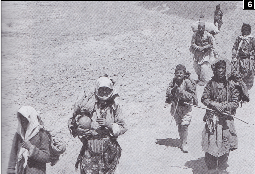
Les civils qui ne sont pas massacrés sur place sont déportés dans le désert. Ils sont harcelés par une « Organisation spéciale » chargée de les massacrer. La faim, la maladie, l'épuisement ont raison de la plupart des survivants.