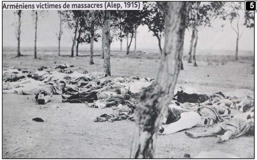
Arméniens victimes de massacres (Alep, 1915)

In Yves Ternon, Les Arméniens, histoire d'un génocide , Le Seuil, coll. « Points Histoire », Paris, 1996.