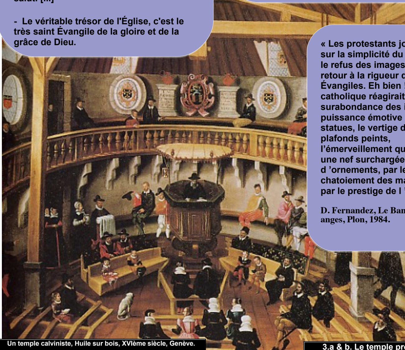
Un temple calviniste, Huile sur bois, XVIème siècle, Genève.

D. Fernandez, Le Banquet des anges , Plon, 1984.